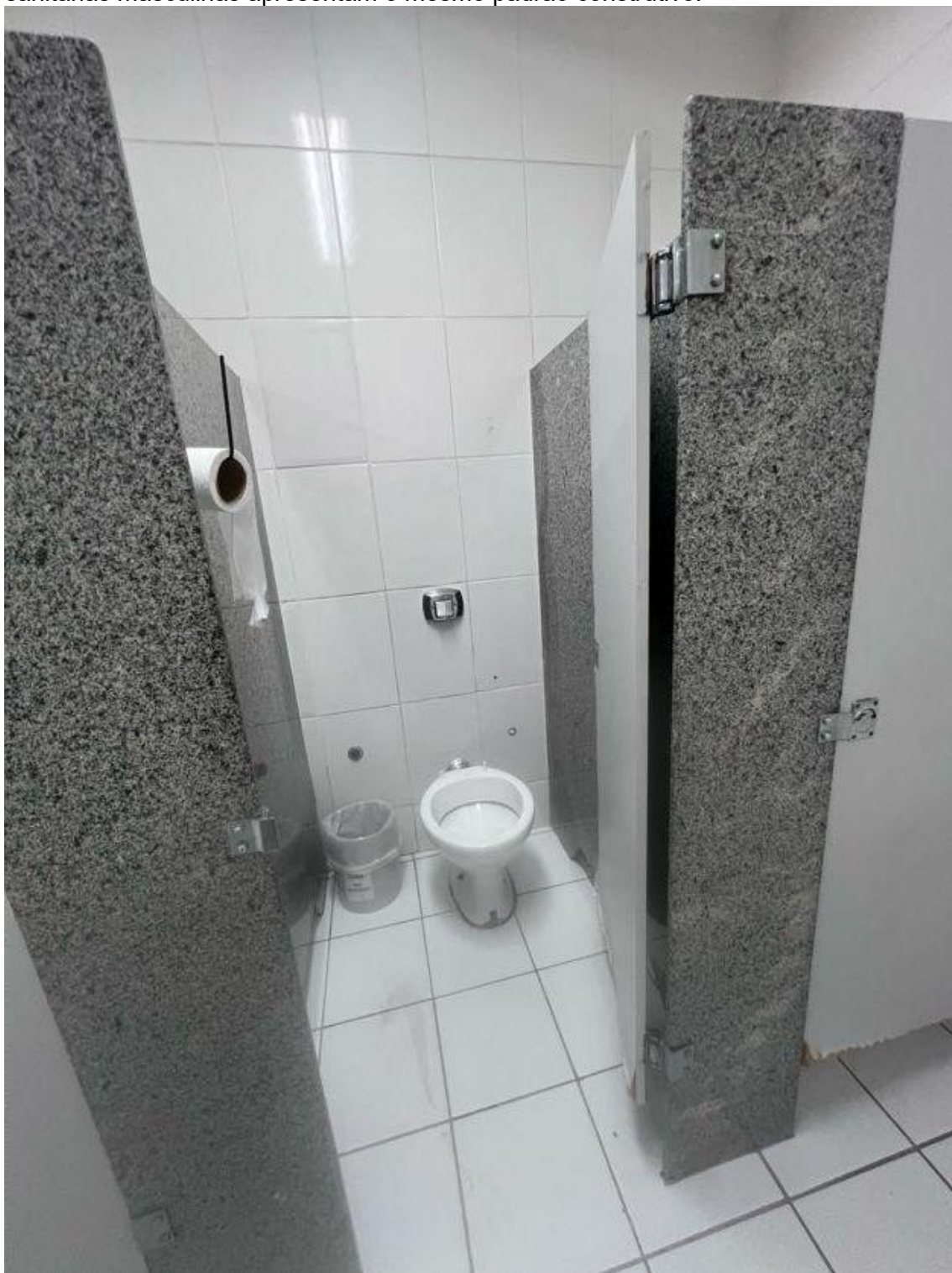
Figura 05: Cabine com sanitário da instalação sanitária coletiva feminina. As instalações sanitárias masculinas apresentam o mesmo padrão construtivo.

COORDENAÇÃO DE INFRAESTRUTURA E PROJETOS